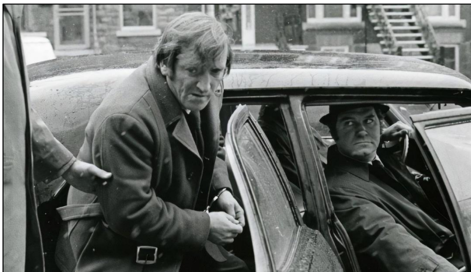
Image tirée du film Les Ordres (1974), qui s'inspire des événements d'octobre 1970

Souvent, pour dessert, on fait des tartes au sucre ou des tartes à la citrouille.