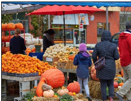
Un marché d'automne