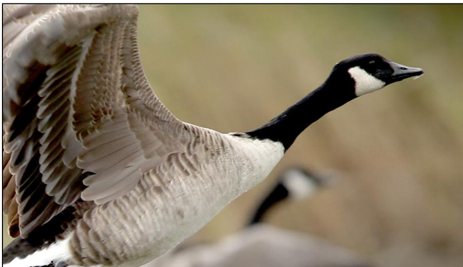
Une bernache du Canada, aussi appelé « outarde » au Québec

Malheureusement, ces oiseaux sont en danger. Les changements climatiques et les variations de température affectent la migration : ils ont de la difficulté à savoir quand ils doivent partir et revenir. La chasse, rendue illégale au Canada, est aussi un problème pour ces oiseaux.