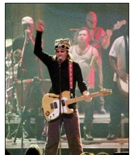
André « Dédé » Fortin

En 2006, sa famille a créé la fondation André Dédé Fortin. Elle vient en aide aux personnes qui ont des problèmes liés à la santé mentale et au suicide.